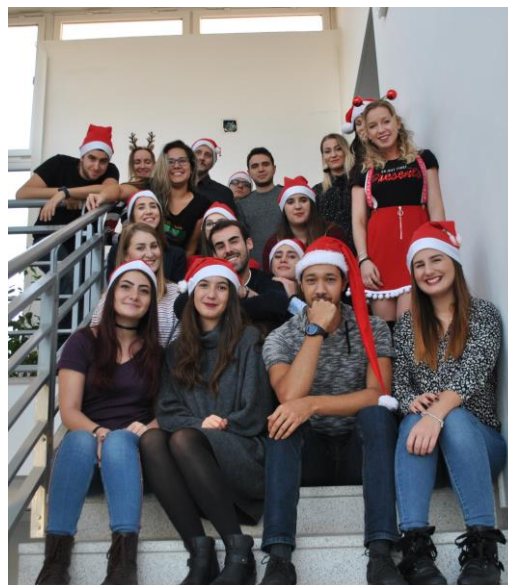
Obr. č. 6: Pre X-mas meeting