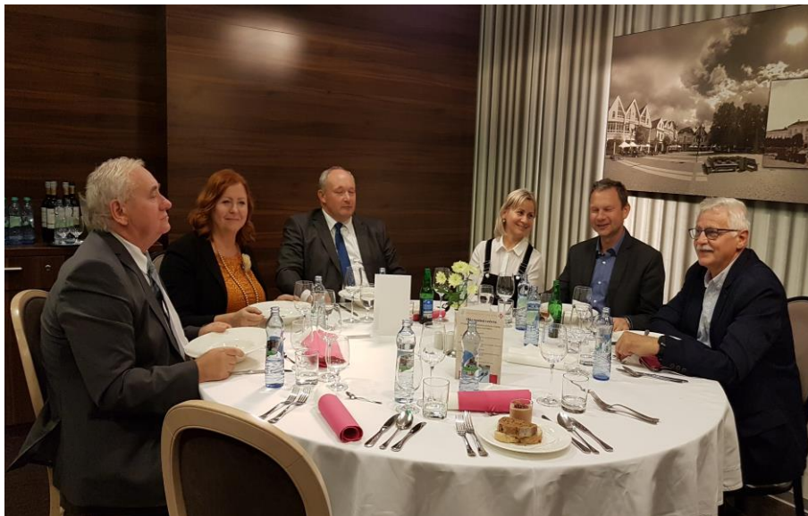
Obr. č. 4: Slávnostné posedenie v Holiday Inn Žilina