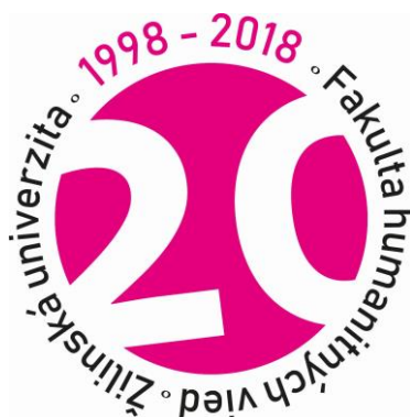
Obr. č. 1. Výročné logo FHV UNIZA, autorka PaedDr. Silvia Antolová, PhD. (KMKD)