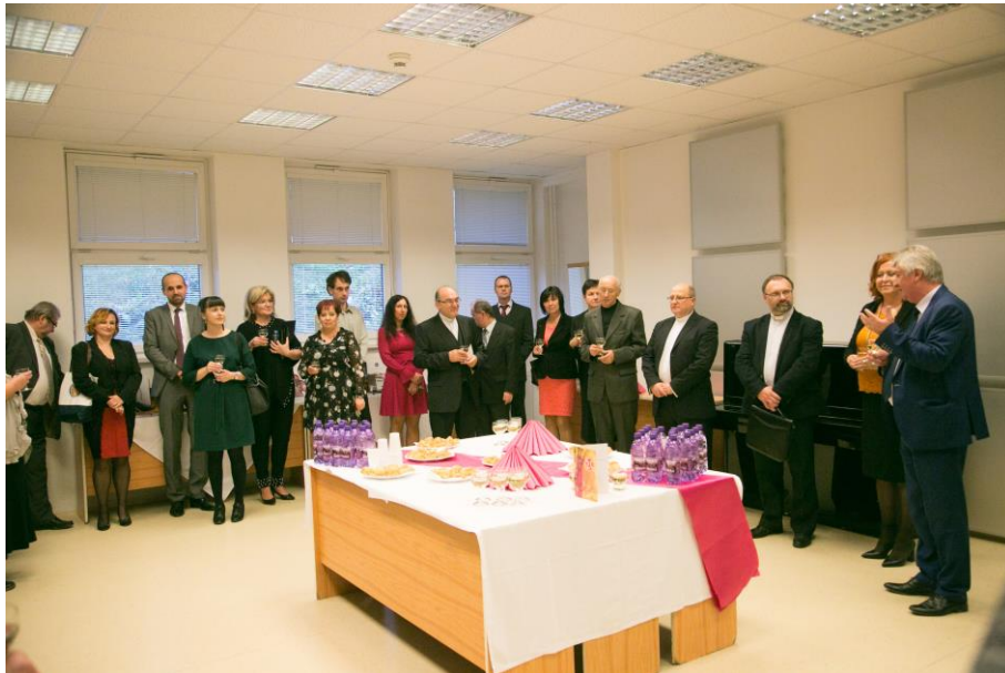
Obr. č. 3: Otvorenie Výstavy najvýznamnejších publikácií pracovníkov fakulty