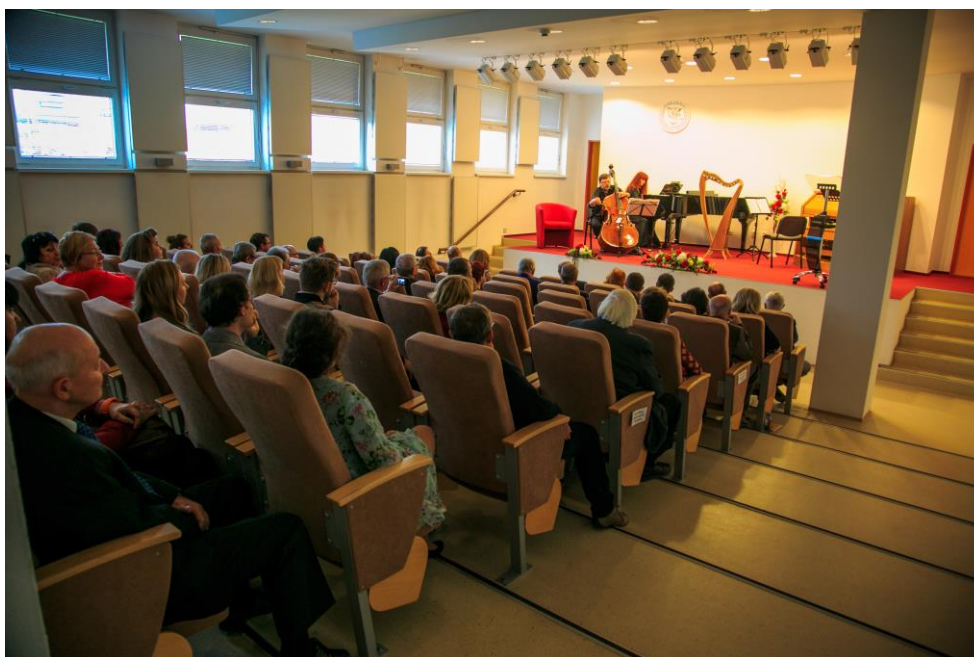
Obr. č. 2: Umelecké pásmo pri príležitosti osláv 20. výročia vzniku