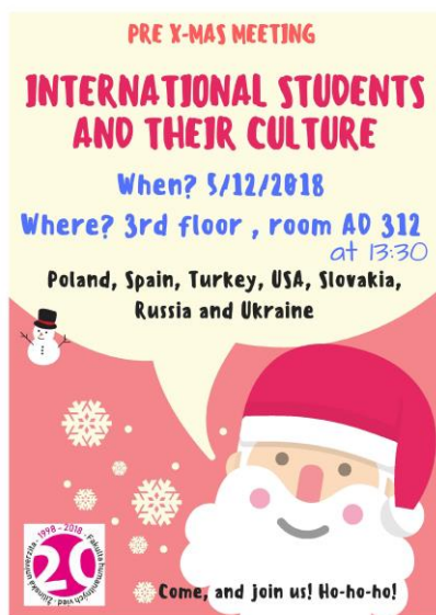
Obr. č. 5: Pozvánka na Pre X-mas meeting